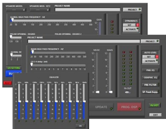
Software proprietario AUDEIA per la gestione del DSP tramite PC .